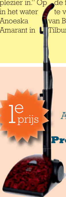
Art stofzuiger Miele Professional