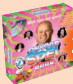
Bordspel onvoorSPELbaar van Identity Games